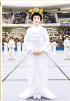
花嫁化粧着付競技(モデル)