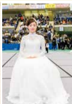
洋装ブライダル競技(モデル)