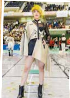
フリースタイル競技(モデル)