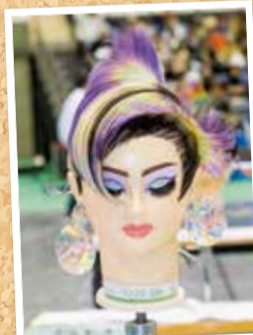
カット&ブロー競技(ウィッグ)