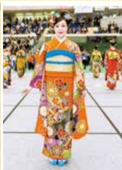
中振袖着付競技(モデル)