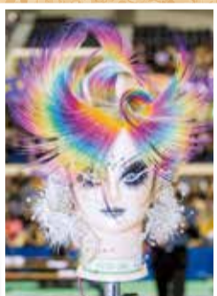
ヘアスタイル競技(ウィッグ)