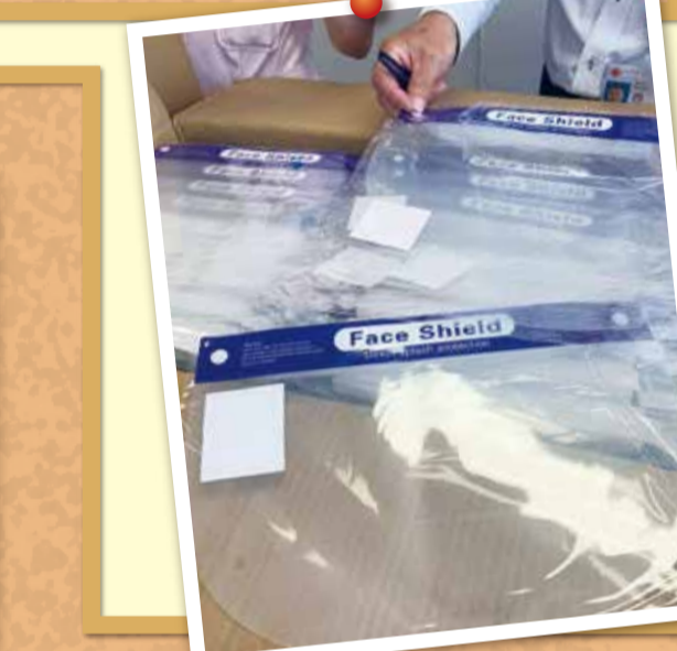
広島県美容業生活衛生同業組合より、消毒液とフェイスシールド等を広島市と呉市、庄原赤十字病院へ寄贈致しました。まだまだ新型コロナウイルス感染症の影響で先行きは不透明ですが、様々な努力と工夫を重ねてこの難局を一丸となって乗り越えましょう。